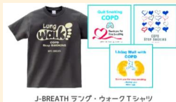
J-BREATH ラング・ウォークTシャツ

抽選で50名様にJ-BREATHオリジナルのCOPD啓発「ラング・ウォークTシャツ」が当たります。